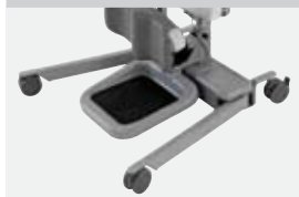
Pieds de châssis

Les pieds de châssis motorisés réglables peuvent être écartés pour permettre l'accès au fauteuil, au fauteuil roulant ou aux toilettes.