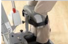
Support pour les jambes et les genoux

Le repose-jambes / support genoux rembourré peut être réglé verticalement et latéralement pour assurer un confort individuel.