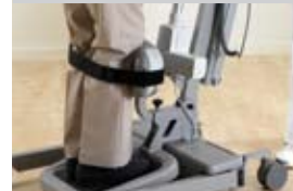
Sangle pour les genoux

Il assure une stabilité supplémentaire ou un support ferme lorsque le résidant n'est pas en mesure de complètement contrôler le mouvement de ses jambes.